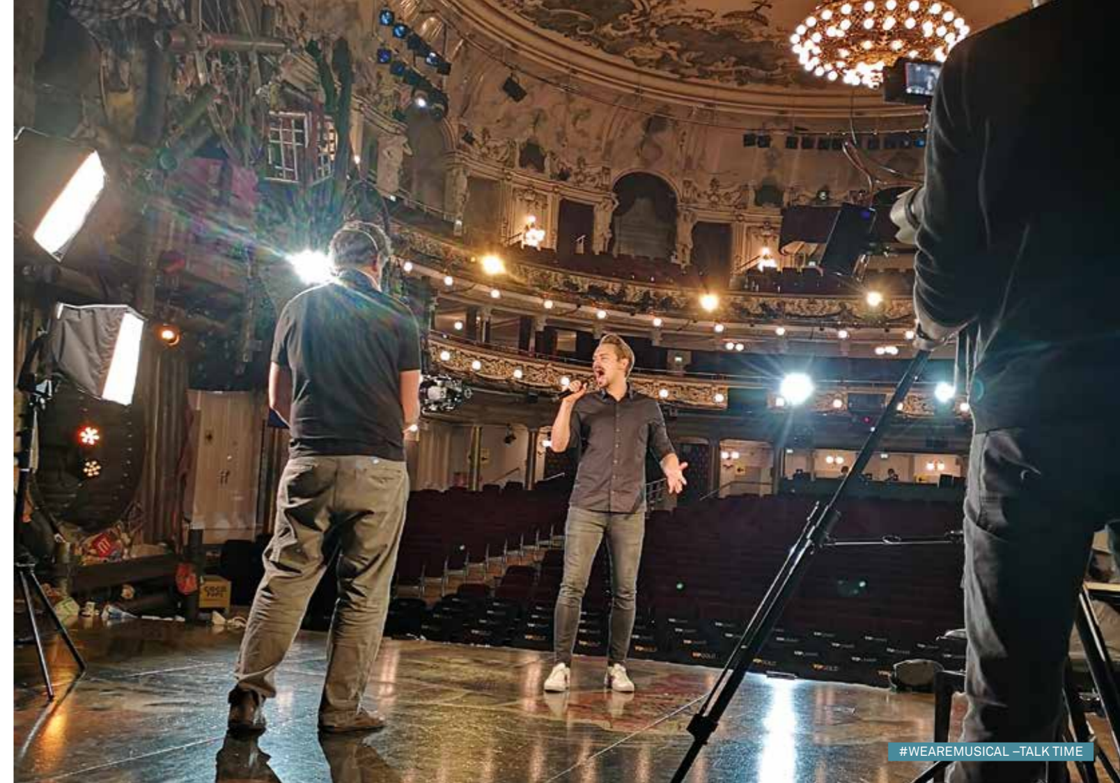
#WEAREMUSICAL - TALK TIME