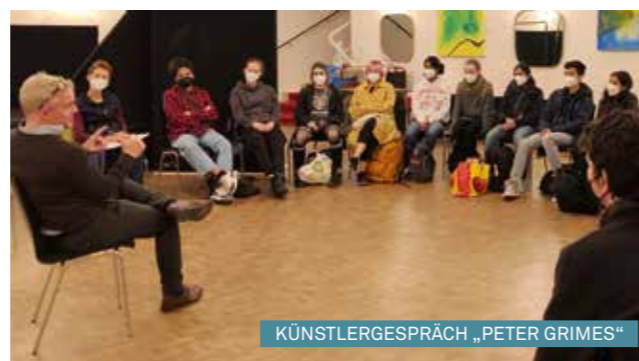
KÜNSTLERGESPRÄCH „PETER GRIMES“