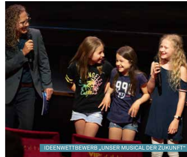
IDEENWETTBEWERB „UNSER MUSICAL DER ZUKUNFT“