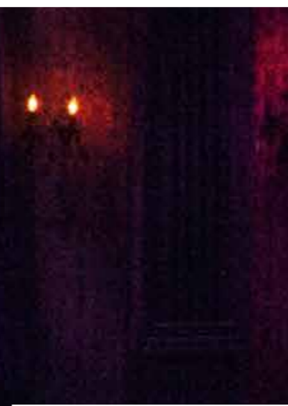
REBECCA / KOREA