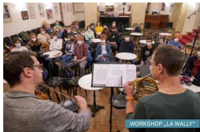
WORKSHOP „LA WALLY“