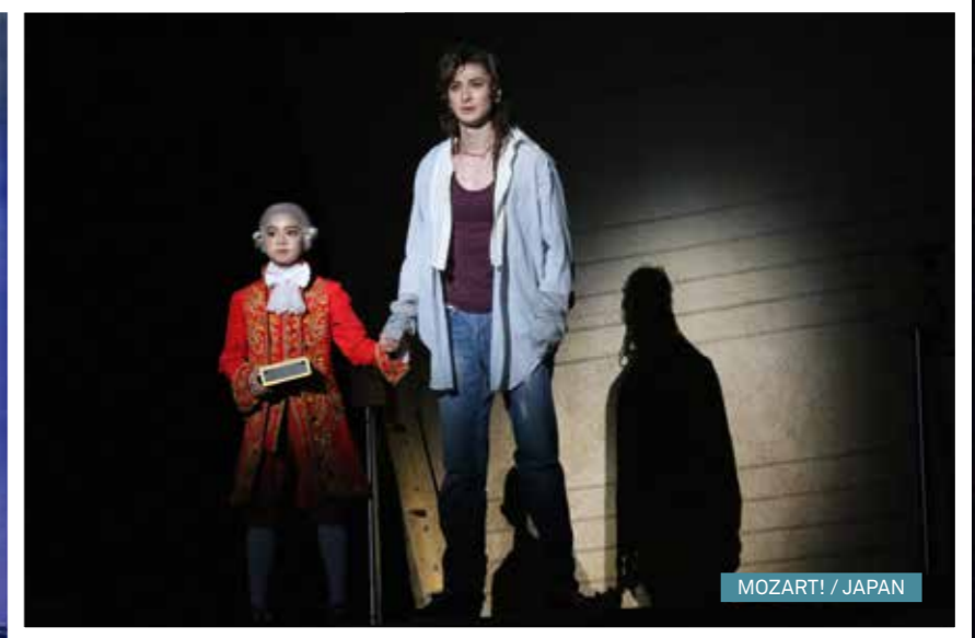
MOZART! / JAPAN