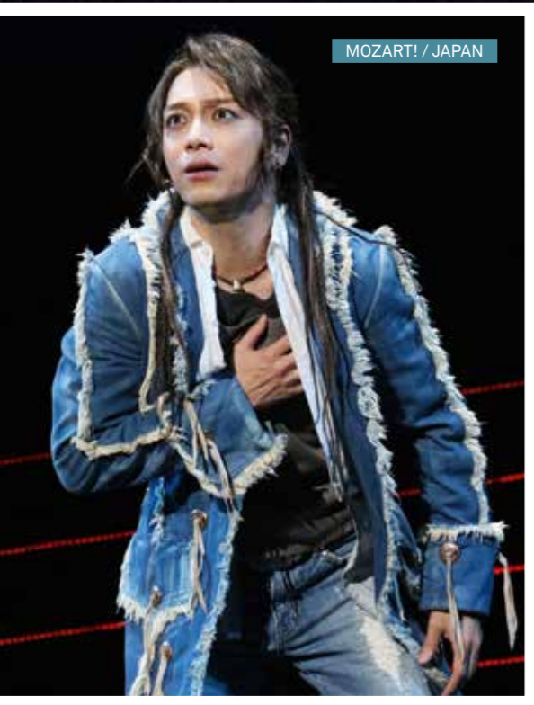
MOZART! / JAPAN