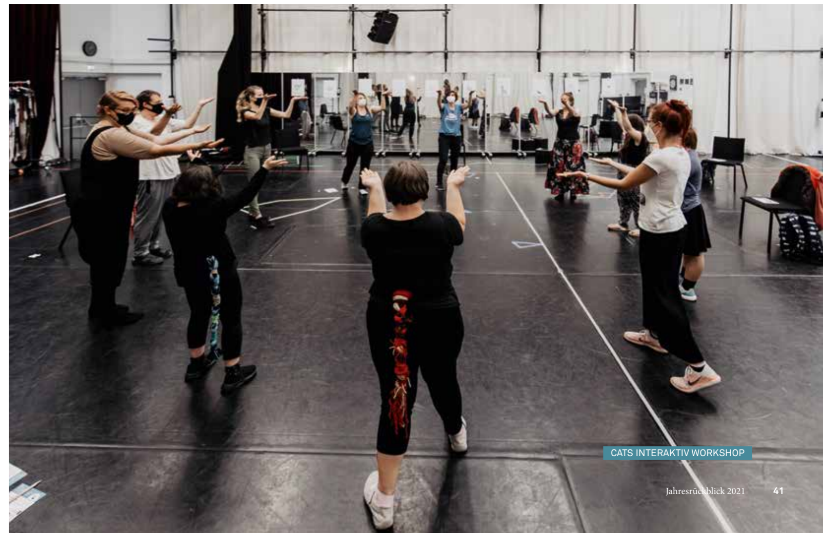
CATS INTERAKTIV WORKSHOP