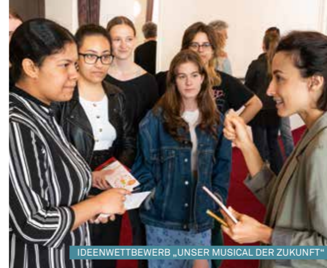
IDEENWETTBEWERB „UNSER MUSICAL DER ZUKUNFT“

TEILNEHMER*INNEN: 10 (plus Betreuungspersonen)