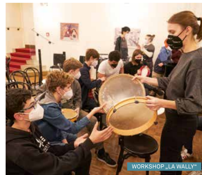
WORKSHOP „LA WALLY“