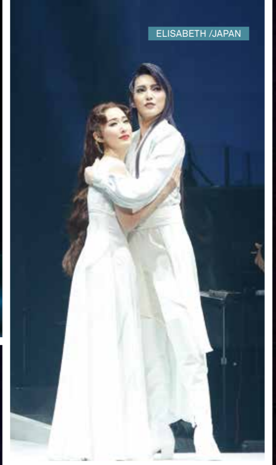
ELISABETH / JAPAN