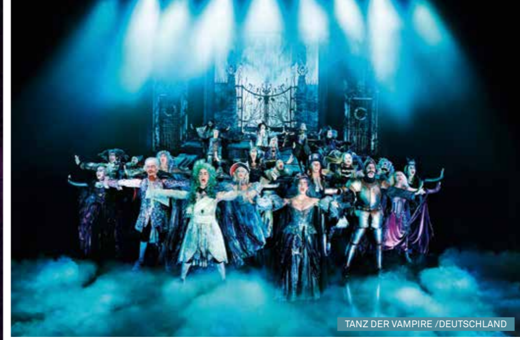
TANZ DER VAMPIRE / DEUTSCHLAND