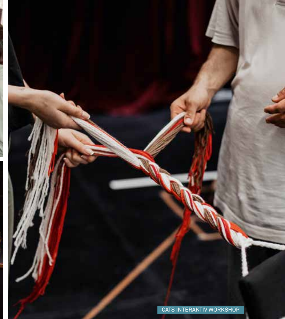
CATS INTERAKTIV WORKSHOP